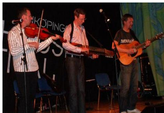
Två meter höga Väsen svajar i polsketakt...

Först ut på programmet var Väsen. De hade ett ganska späckat schema den helgen. Fredag lunch var de i Växjö och spelade med Musica Vitae, sedan upp till Linköping och spela på kvällen för att sedan på söndagseftermiddagen spela i Malmö med Musica Vitae. En mycket trevlig konsert som undertecknad avnjöt efter Linköping. Visserligen hade vi fått en rejäl dos med folkmusik på festivalen, men det var inget som hindrade oss från att gå på konsert, direkt när vi var tillbaka. Det var första gången jag sett Musica Vitae-musiker le när de spelar och dessutom svängde det riktigt bra om orkestern. Väsen lyckas alltså t o m få igång och smitta av sig på en strikt stråkorkester, inte illa.